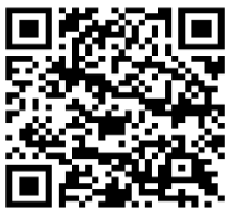
【リエイブルメント冊子 QRコード】