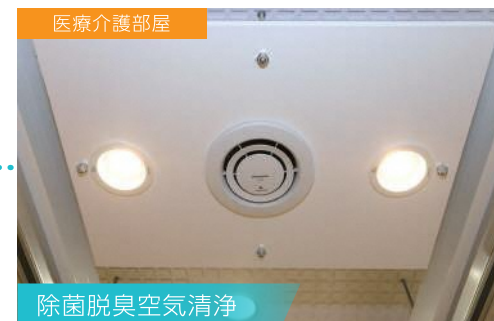
除菌脱臭空気清浄