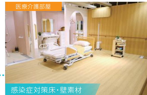
感染症対策床・壁素材

感染症対策を施した抗ウイルス・抗菌・消臭・抗アレルギー機能を備えた床・壁素材は、新しい時代のスタンダード。