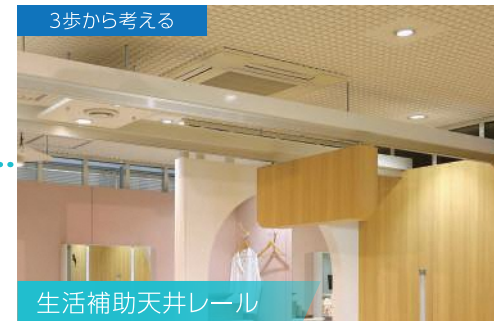
生活補助天井レール

天井走行レールを使って医療介護に必要な道具箱を選び、移動リフトを装備することもできる。