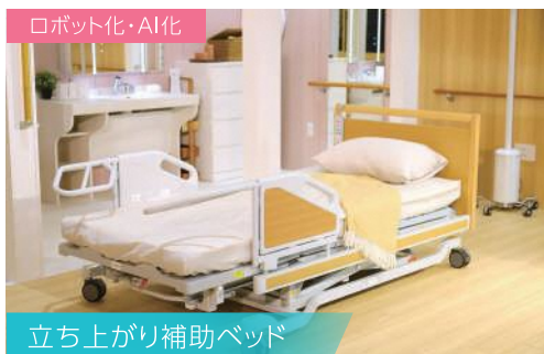
立ち上がり補助ベッド

ベッドは寝る場、休む場から、暮らしの場となる。立ち上がりの負担を減らす可動機能のついた最新ベッドを設置。