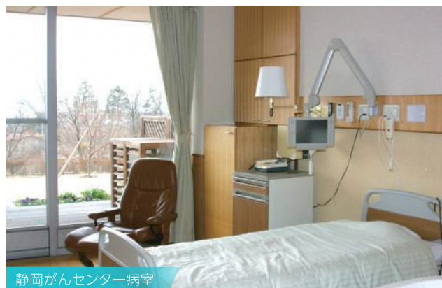
静岡がんセンター病室

20年にわたる静岡がんセンターの経験から、 病室とホテルの部屋をモデルにして 住まいのありかたを求めました。