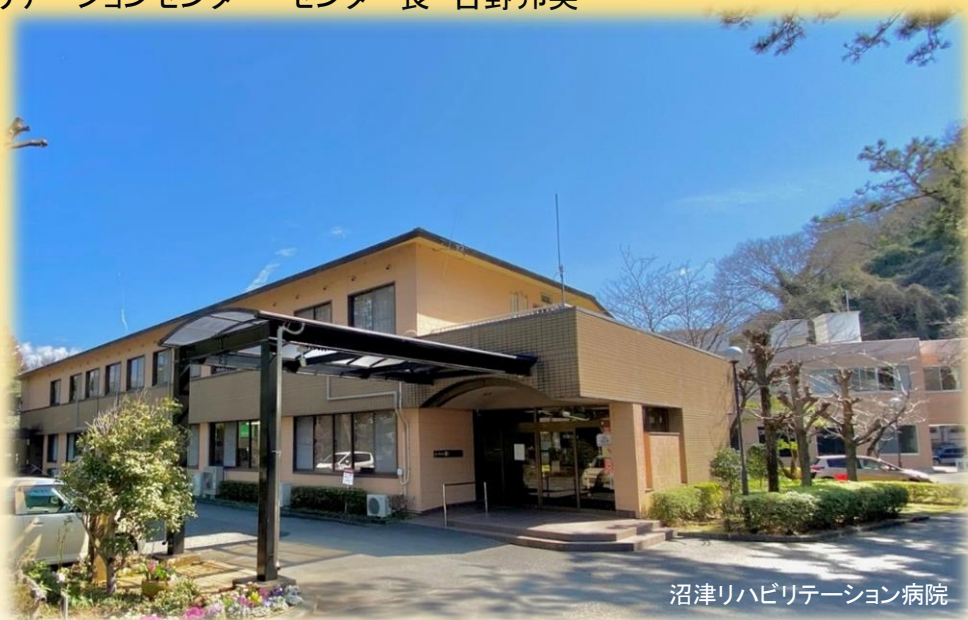
沼津リハビリテーション病院

後援: 静岡県 静岡県医師会 静岡県歯科医師会 静岡リハビリテーション医学会 静岡県薬剤師会 静岡県栄養士会 静岡県歯科衛生士会 静岡県歯科技工士会 静岡県介護福祉士会 静岡県社会福祉協議会 静岡県介護支援専門員協会 静岡県医療ソーシャルワーカー協会 予定